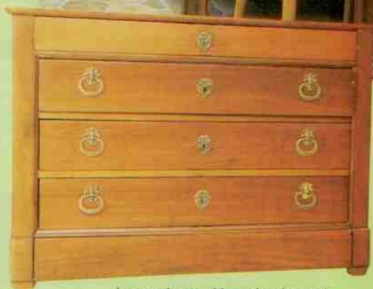
Le premier meuble ancien du couple : une commode de port nantaise, en acajou, d'époque Restauration (1815-1830).